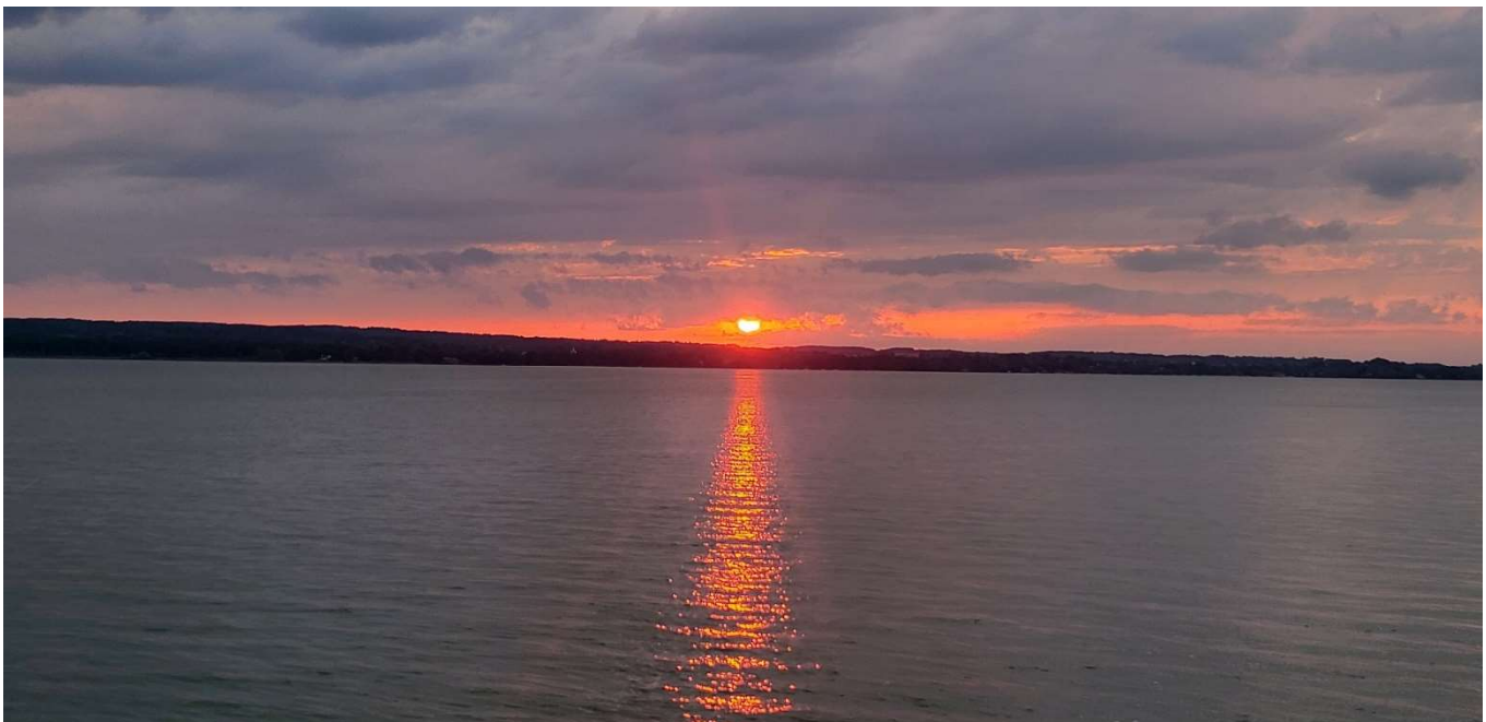
„Abendstimmung auf dem Ammersee“

Sommerkäse, Gorgonzola, Roquefort, Tölzer Butterkäse, Walnusskäse, Schinkenkäse, Pfefferkäse, garniert mit roten und weißen Weintrauben, Carambola, Physalis, Kiwi, Apfel und Birnen dazu Baguette, Schwarzbrot, Sauerteigbrot und Butter